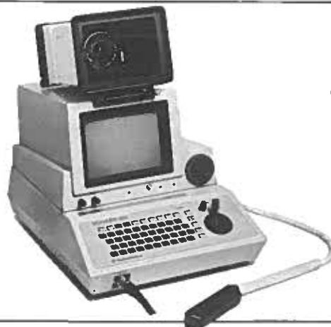
SCANNER 450V Ultraschallscanner mit 5 MHz Rektalsonde. Für die Trächtigkeits- diagnose in der Pferde-, Rinder- und Schafzucht.

medical instrument marketing ag CH-8253 Diessenhofen, Tel. 053-77095